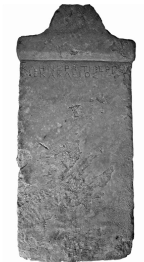
Figura 1. Estela dedicada a Clenerete. Atenas, fin del siglo V a.C.