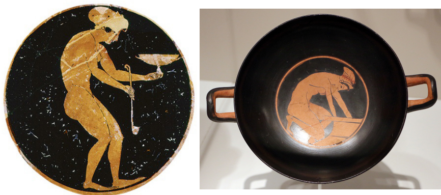
Figura 2. Esquerra, detall del centre d'una kylix d'Oltos on apareix una dona despallada en el moment de servir el vi (510 a. C.). Ashmolean Museum. Com en d'altres casos, el pintor perseguia la sorpresa i la riialla del comensal, que, a mesura que anava buidant la copa, veia com s'anava descobrint el cos de la noia. Dreta, hetaira traient aigua d'un pithos (500 a. C.). Indianapolis Museum.

Els elements distintius que tradicionalment s'han atribuït a les prostitutes en les representacions vasculars s'han basat, d'una banda, en l'aparença i l'abillament i, d'una altra, en l'actitud i l'activitat en què apareixien representades. Així doncs, s'ha intentat buscar elements identificadors de la seva feina en el vestit, en els ornaments, en els tipus de pentinat i també en algunes activitats que alguns estudiosos lliguen de forma inextricable a aquesta professió.