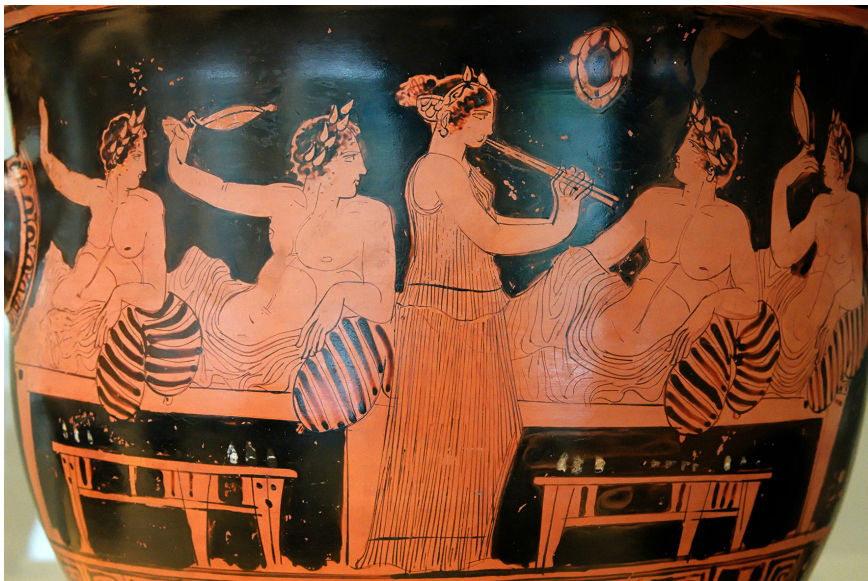
Figura 3. Cratera de campana del pintor de Nícias amb imatge simposíaca on apareix una tocadora d'aulós amenitzant la vetllada (420 a. C.). Museo Arqueológico Nacional, Madrid.

Fins a quin punt, però, això responia a la realitat d'aquest ofici i quines eren les activitats que desenvolupaven aquestes instrumentistes? Realment anaven més enllà de participar amb el seu instrument en aquestes celebracions? Com assenyala Starr, les noies que tenien una formació com a flautistes no eren necessàriament esclaves, sinó que es podia tractar de dones lliures. L' aulós no era precisament un instrument fàcil de tocar, per tant calia seguir una formació, i sabem que aquestes noies n'aprenien en escoles especialitzades. Així doncs, gaudien d'un cert grau d'instrucció 27 .