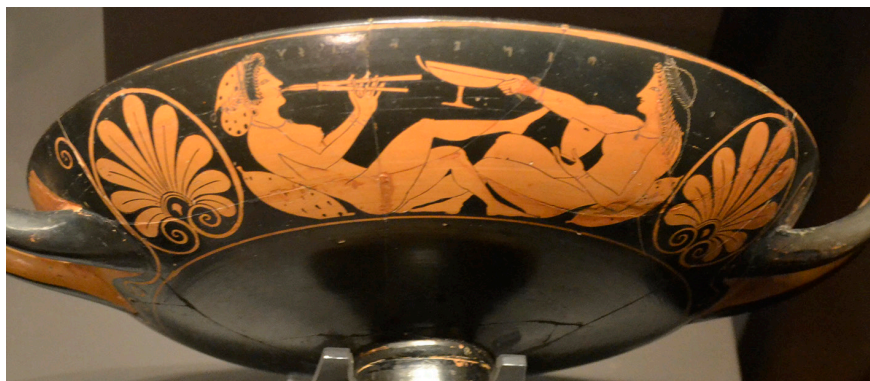
Figura 5. Kýlix àtica atribuïda al pintor d'Oltos (525-475 a. C.). Trobada a Vulci (Itàlia) amb inscripció d'una conversa en què l'una diu a l'altra: «Beu!» (πίνε), i l'altra li respon: «Tu també!» (καὶ σὺ). Museo Arqueológico Nacional, Madrid.

titució i fossin objecte de desig per part dels homes que hi participaven. Aquesta circumstància és la que, idíl·licament, representen alguns dels vasos simposiàcs on apareixen auletrides , com a la figura 5, on veiem dues dones despullades en un simposi bevent i tocant l' aulós .