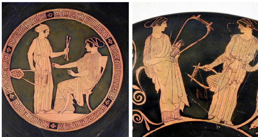
Figura 4. La copa de les músiques on apareixen diverses dones tocant instruments, tant a la part interior com a tot l'exterior. Trobada a la Toscana (ca. 450 a. C.) (font: Museo Civico Archeologico, Bologna).

la teoria que tocar un instrument no era un fet aïllat o propi d'un grup de dones, sinó que estava bastant més estès del que imaginem, i que si bé hi hauria flautistes professionals i també dones respectables que tocaven algun instrument per plaer, també podem trobar prostitutes que tenien formació musical i que exhibien aquesta capacitat davant dels seus clients.