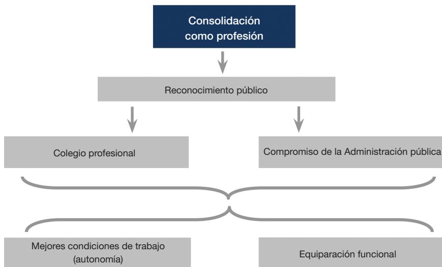
Gráfico 2. Variables de futuro de la profesión